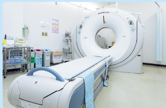
寝台へ仰向けになった状態で、5~10秒程度の息止め撮影を行います。検査時間は5分程度です。

当院では、被ばく量を抑えながら高画質な画像を得られるCT検診を実施しております。専門医による読影と、県内最安値レベルの費用設定により、早期発見と受診しやすい環境を提供しています。